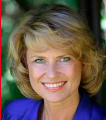
Dagmar Wöhrl Parlamentarische Staatssekretärin beim Bundesminister für Wirtschaft und Technologie

den Jahrzehnten ein Umbruch in Wirtschaft und Gesellschaft stattfinden. Um die Herausforderungen des globalen Wettbewerbs meistern zu können, sind die Unternehmen gefordert, die Weichen für die Zukunft richtig zu stellen.